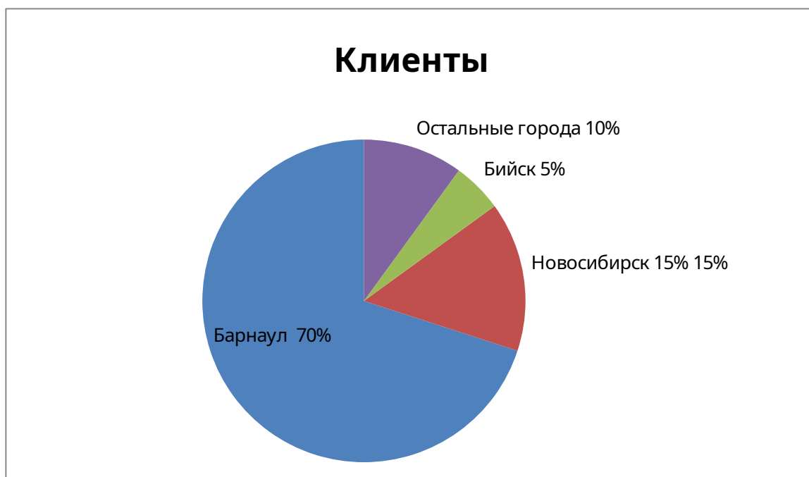
Рисунок 2 – Основные показатели туристской базы

Туристическая фирма «Джейн Тур» на рынке туризма работает 17 лет [7]. В настоящее время компания имеет большое количество постоянных клиентов. Объем потока клиентов в туристическую фирму «Джейн Тур» в процентном соотношении составляет (Рисунок 2):